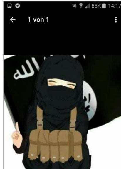
"Wehrhafte" IS-Anhängerin: Auch Frauen sollen mit Terrorattacken gegen "Ungläubige" kämpfen.