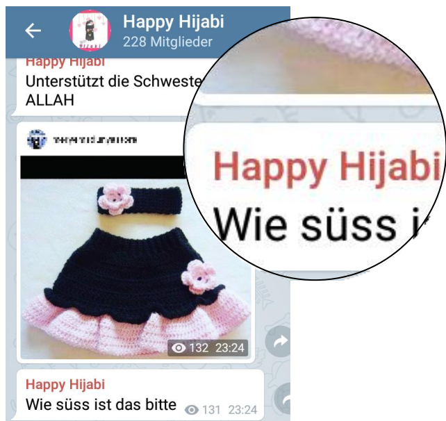
Babykleidung als Eye-Catcher: Dschihadistische Beiträge zielen auf junge Frauen mit Kinderwunsch.

Auf dschihadistischen Angeboten für Mädchen und junge Frauen findet diese Vorstellung ihren Widerhall zum Beispiel in Darstellungen von appetitlich zubereiteten Speisen, Babykleidung, Bastelanleitungen, Erziehungstipps und Kochrezepten.